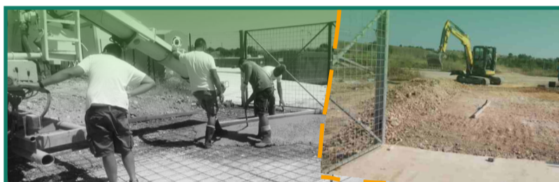
Centro Intercomunale di Raccolta per l'economia circolare Contrada Giacheria